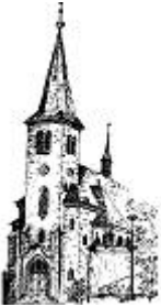
St. Laurentius Rudersdorf

Redaktionsschluß: 20.01.2019 um 11.00 Uhr