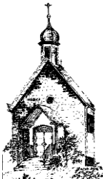
St. Antonius Anzhausen