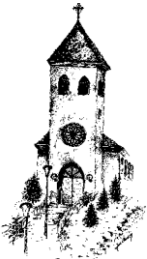
St. Johannes Ev Gernsdorf