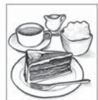
Kaffee und Kuchen

Anmeldung bitte in der Kirche oder beim Vorstand.