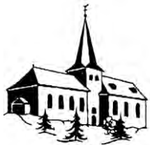
St. Johannes Baptist Rödgen